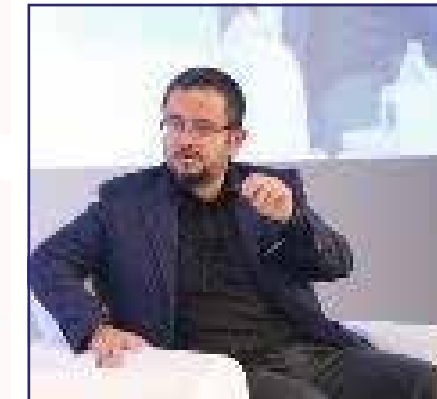
Ali Sabancı Esas Holding Yönetim Kurulu Başkanı VIII. KURUMSAL YÖNETİM ZİRVESİ