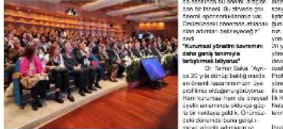
Konferansın düzenlendiği salonun genişliği ve katılımcıların yoğunluğu.

Türkiye Kurumsal Yönetim Derneği (TKYD) Yönetim Kurulu Başkanı Dr. Tamer Saka, "Kurumsal yönetim sadece şirketler için değil, toplum için de önemlidir. Bu nedenle, kurumsal yönetimin yaygınlaşmasını destekliyoruz" diyor.