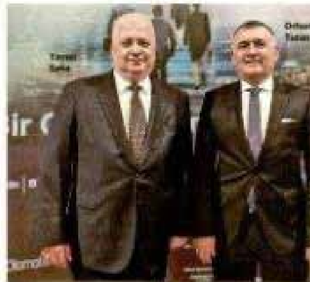
"Daha İyi Bir Gelecek İçin Kurumsal Yönetim"

YAKINLAR DÜNYA GÖZÜ TKYD'nin kuruluşu, Türkiye'nin ekonomik büyümesini hızlandırmaya yönelik önemli bir adım olarak değerlendiriliyor. Saka, "Kurumsal yönetim sadece şirketler için değil, toplum için de önemlidir. Bu nedenle, kurumsal yönetimin yaygınlaşmasını destekliyoruz" diyor.