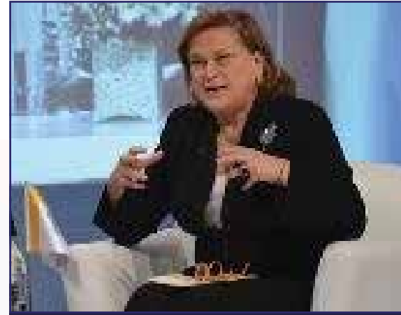
Güler Sabancı Sabancı Holding Yönetim Kurulu Başkanı VI. KURUMSAL YÖNETİM ZİRVESİ