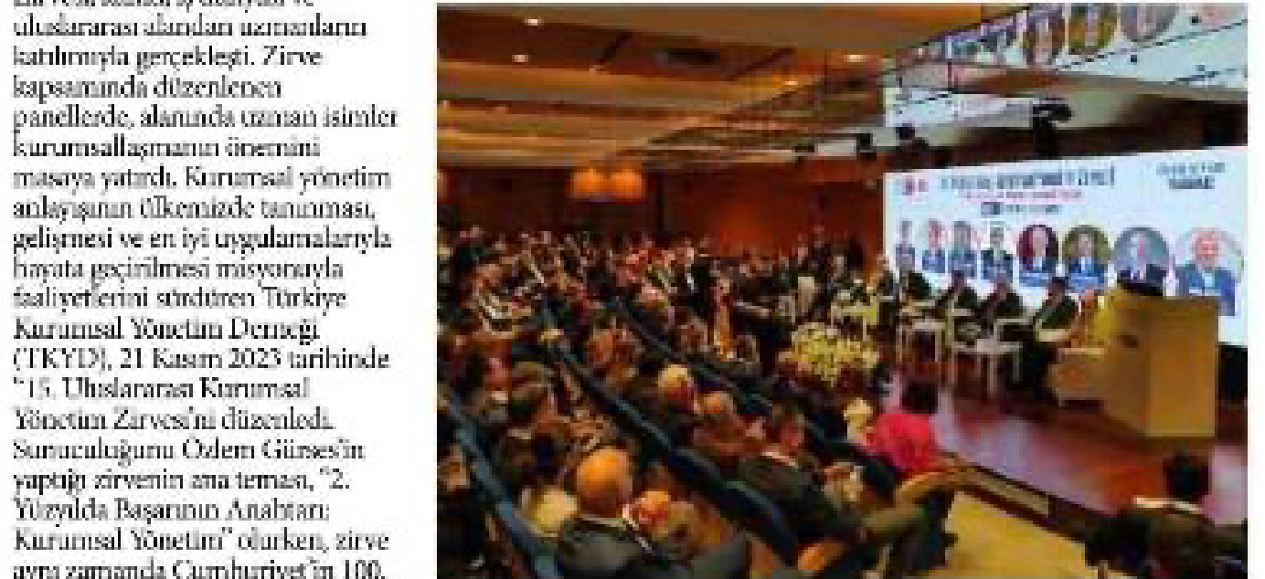
Konferansın düzenlendiği salonun genişliği ve katılımcıların yoğunluğu.

Türkiye Kurumsal Yönetim Derneği'nin (TKYD) düzenlediği 15. Uluslararası Kurumsal Yönetim Zirvesi, İstanbul'da düzenlenen konferansla başladı.