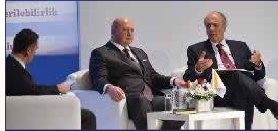
Merhum Mustafa V. Koç - Koç Holding Tuncay Özilhan - Anadolu Grubu Yönetim Kurulu Başkanı VI. KURUMSAL YÖNETİM ZİRVESİ