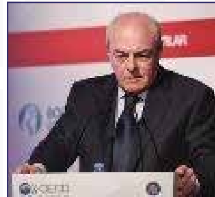
Mervyn E. King, PhD, LLD IIRC Başkanı GRI Onursal Başkanı VII. KURUMSAL YÖNETİM ZİRVESİ