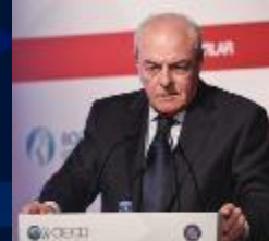
Mervyn E. King, PhD, LLD IIRC Başkanı GRI Onursal Başkanı VII. KURUMSAL YÖNETİM ZİRVESİ