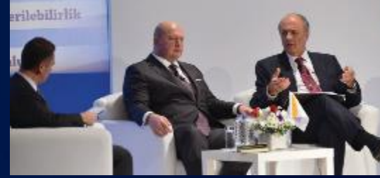
Merhum Mustafa V. Koç - Koç Holding Tuncay Özilhan - Anadolu Grubu Yönetim Kurulu Başkanı VI. KURUMSAL YÖNETİM ZİRVESİ