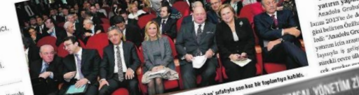
Patronlar, VI. Uluslararası Kurumsal Yönetim Zirvesi kapsamında düzenlenen panellerde bir araya geldi.

Sabancı Holding Yönetim Kurulu Başkanı Güler Sabancı, "Sabancı Holding olarak, 2023'te bir çok alanlarda uluslararası iş birliklerini güçlendireceğimizi ve bu alanlarda faaliyetlerimizi etkin hale getireceğimizi belirttik."