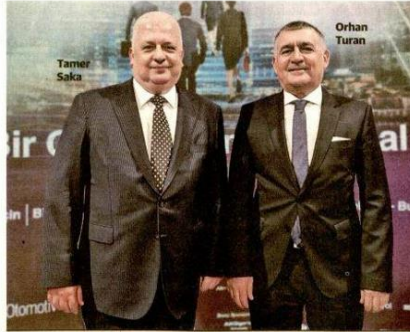
"Daha İyi Bir Gelecek İçin Kurumsal Yönetim"

Türkiye Kurumsal Yönetim Derneği (TKYD) TÜSİAD iş birliğinde, 17 Mayıs 2022 tarihinde 'XIV. Uluslararası Kurumsal Yönetim Zirvesi'ni düzenleyecek. Bloomberg.com'da canlı olarak yayınlanacak. K urumsal yönetim anlayışının ülkemizde tanınması, gelişmesi ve en iyi uygulamalarıyla hayata geçirilmesi Türkiye Kurumsal Yönetim Derneği (TKYD), 17 Mayıs 2022 tarihinde 'XIV. Uluslararası Kurumsal Yönetim Zirvesi'ni düzenleyecek. Bu yıl, TÜSİAD iş birliğinde gerçekleştirilecek olan Zirve'de, ulusal ve uluslararası alandan birçok isim ve konuşmacı olarak yer alacak. "Kurumsal Yönetim kavramının sürdürülebilirlik, rekabet gücü ve sürdürülebilirlik gibi konuların en ileri geleceği için ana teması, "Daha İyi Bir Gelecek İçin Kurumsal Yönetim" olacak.