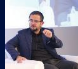
Ali Sabancı Esas Holding Yönetim Kurulu Başkanı VIII. KURUMSAL YÖNETİM ZİRVESİ