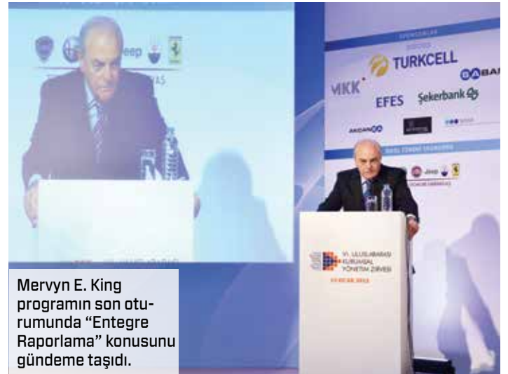
Mervyn E. King programın son oturumunda "Entegre Raporlama" konusunu gündeme taşıdı.

çekebilmeleri için ciddi değişimlerden geçmeleri gerektiği, kurumsal yönetimi özümsemek ve içselleştirmenin daha da önemli hale geldiğini vurguladı.