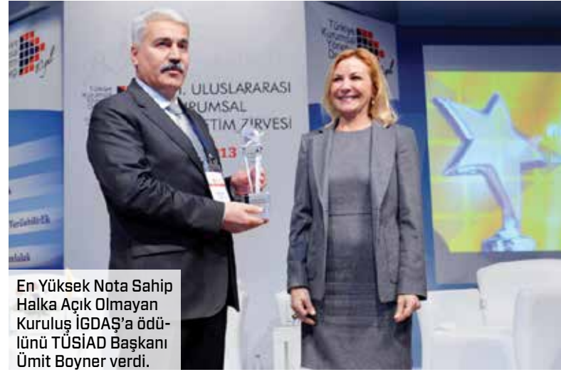
En Yüksek Nota Sahip Halka Açık Olmayan Kuruluş İGDAŞ'a ödülünü TÜSİAD Başkanı Ümit Boyner verdi.