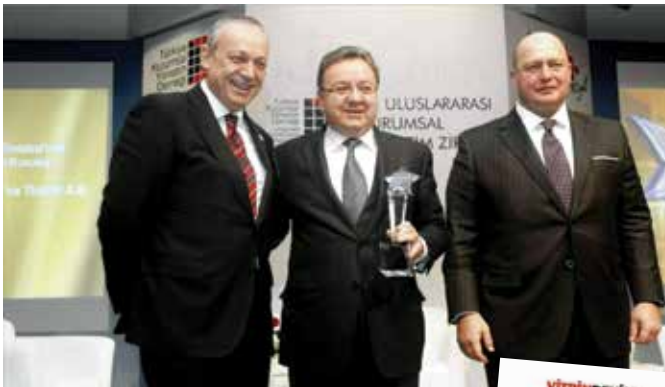
Doğuş Otomotiv'e Kurumsal Yönetim Ödülü...

Ocak-Mart 2013 döneminde konuyu gündemde tutmak ve farklı yönleriyle tartışmaya açmayı amaçlayan Türkiye Kurumsal Yönetim Derneği üyeleri, CNBC-E, Bloomberg HT ve NTV gibi öncü televizyon kanallarında 3 saat 45 dakika konuk olarak yer aldı. Aynı dönemde yazılı basında ise 56 farklı mecrada 94 haberle TKYD çalışmalarını aktardı.