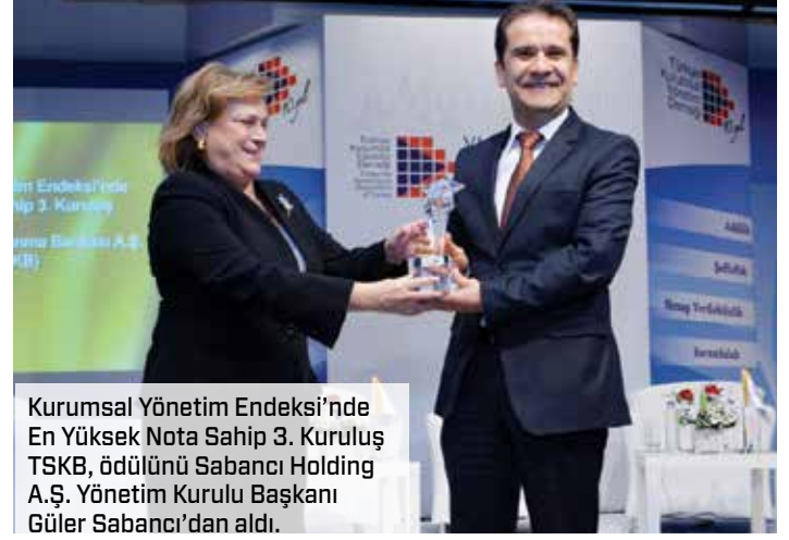
Kurumsal Yönetim Endeksi'nde En Yüksek Nota Sahip 3. Kuruluş TSKB, ödülünü Sabancı Holding A.Ş. Yönetim Kurulu Başkanı Güler Sabancı'dan aldı.