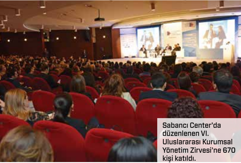
Sabancı Center'da düzenlenen VI. Uluslararası Kurumsal Yönetim Zirvesi'ne 670 kişi katıldı.