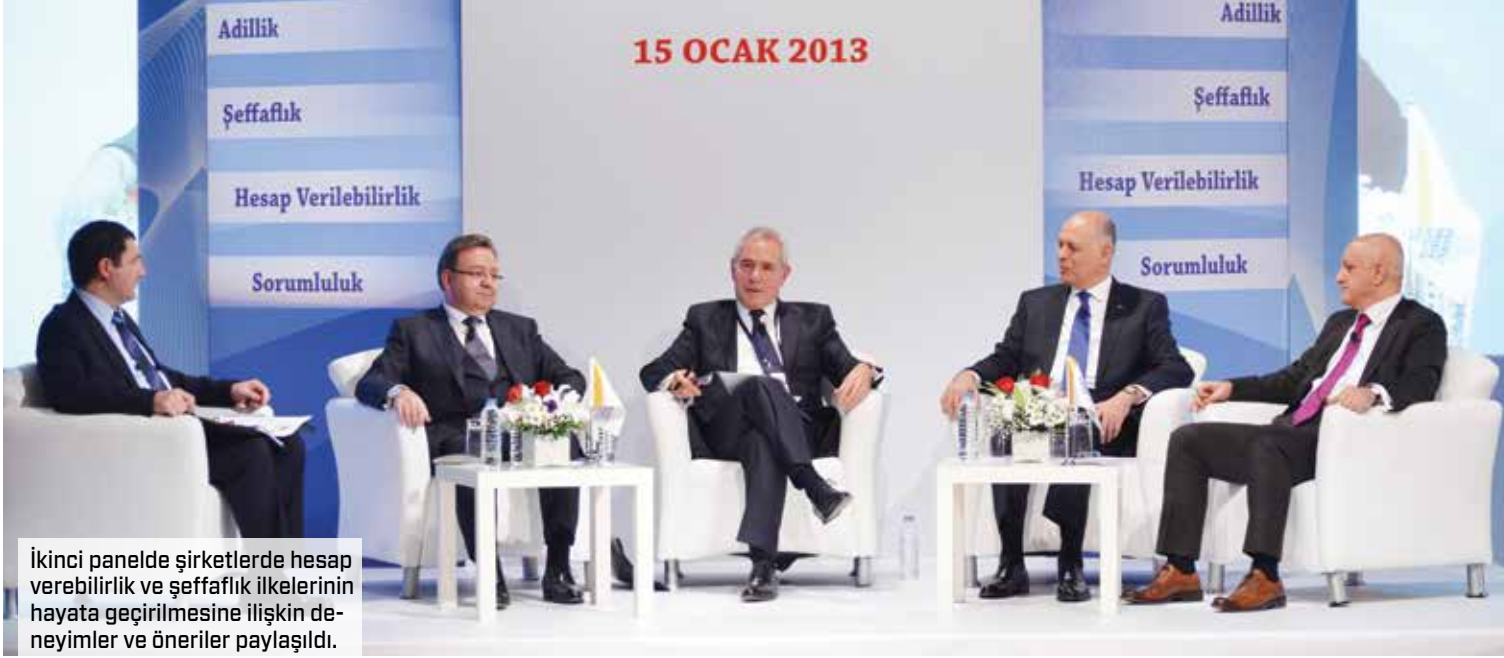
İkinci panelde şirketlerde hesap verebilirlik ve şeffaflık ilkelerinin hayata geçirilmesine ilişkin deneyimler ve öneriler paylaşıldı.