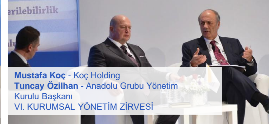
Mustafa Koç - Koç Holding Tuncay Özilhan - Anadolu Grubu Yönetim Kurulu Başkanı VI. KURUMSAL YÖNETİM ZİRVESİ