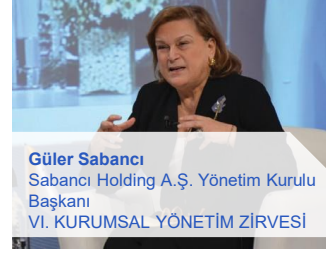
Güler Sabancı Sabancı Holding A.Ş. Yönetim Kurulu Başkanı VI. KURUMSAL YÖNETİM ZİRVESİ