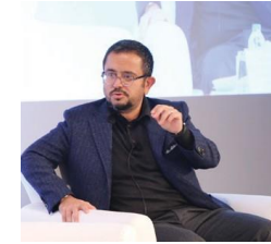
Ali Sabancı Pegasus A.Ş. Yön. Kurulu Başkanı VIII. KURUMSAL YÖNETİM ZİRVESİ