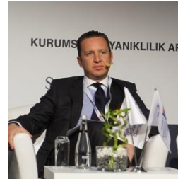
Batu Aksoy Turcas Petrol CEO'su ve Yönetim Kurulu Üyesi XI. KURUMSAL YÖNETİM ZİRVESİ