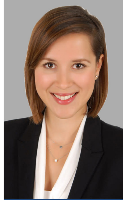
AV. AHU SAZCI UZUN Hergüner Bilgen Özeke Avukatlık Ortaklığı, Avukat